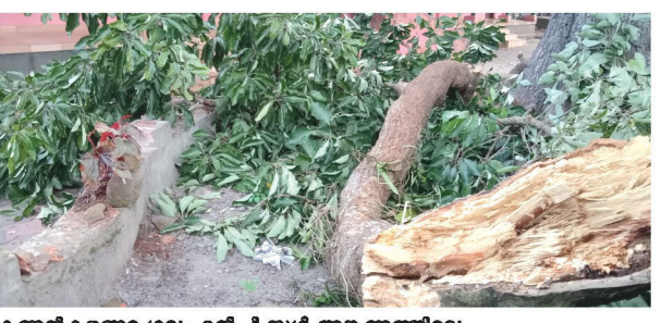
കണ്ണൻകളങ്ങര ഗവ എൽപി സ്കൾ അങ്കണത്തിലെ കൂറ്റൻ മരത്തിന്റെ വലിയ ചില്ല ഒടിഞ്ഞുവീണ നിലയിൽ